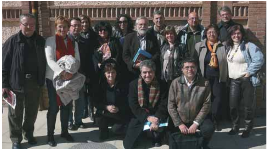
La nova Junta Directiva de l'entitat en una foto de família.

Divuit membres, alguns dels quals de nova incorporació, van ser els elegits per formar la nova Junta Directiva del CECBLL, després de la darrera assemblea ordinària general d'associats que es va fer a la sala d'actes del Centre Sant Lluís de la Colònia Güell. Prèviament a l'assemblea, una trentena llarga d'associats, amics i col·laboradors van participar en una nova convocatòria de "Puja al Baix!", organitzada per visitar a fons el Centre d'Interpretació de la Colònia, la cripta de Gaudí i una part important del patrimoni arquitectònic i social de la Colònia, vist amb ulls de dona, tal com anunciava el full de convocatòria de la trobada. La visita va ser tan intensa que no va ser possible fer tot el recorregut previst, de manera que els organitzadors van acordar fer una nova convocatòria amb el