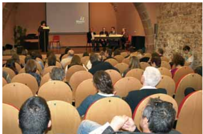
La sala d'actes atapeïda de gent en la presentació del llibre.

La sala d'actes del castell de Pallejà va ser l'escenari elegit per a la presentació de la nova publicació que recull la vintena de treballs de la darrera convocatòria de la Trobada de Recerca Jove de l'any 2009, que també, com és tradicional, es va fer a Pallejà el mes de maig d'aquest mateix any. En l'acte de presentació presidit per l'alcalde de la localitat, la directora adjunta dels Serveis d'Educació del Baix Llobregat, el conseller comarcal d'Educació i el president del CECBLL, amb presentació de la responsa-