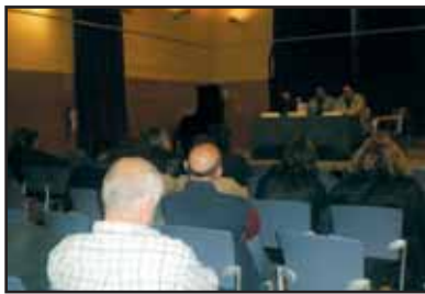
A dalt, imatge de la presentació de la publicació a la Biblioteca Antoni Martín del Prat de Llobregat. A sota, a la sala de l'Antic Escorxador de Begues.