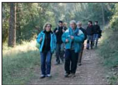
A la fotografia superior, una imatge de la sortida a Pujalt amb els camps d'entrenament, i a baix, el camí forestal de l'Obaga a la Palma de Cervelló.