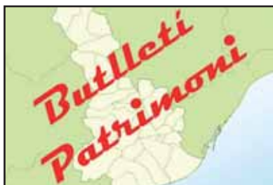
El Butlletí de Patrimoni del CECBLL té vocació d'aplegar tots els temes de referència patrimonial que es produeixen a la comarca. Amb una periodicitat trimestral i a través de la xarxa, aquest butlletí serà una eina de participació i debat.