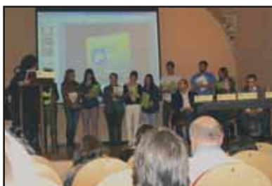
A la fotografia superior, una imatge de l'escenari durant la presentació de l'acte. A sota, els estudiants guanyadors en el moment de lliurar-los-hi el seu exemplar de la publicació.