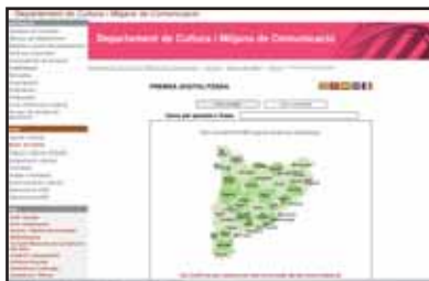
Caràtula de la pàgina de consulta digital de la XAC-Prensa dels arxius comarcals de Catalunya.