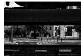
Fotografia guanyadora del concurs 2015.

Organitzador: Biblioteca Montserrat Roig