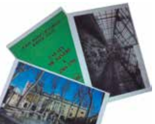
Material de les activitats educatives d'Arrels Locals.