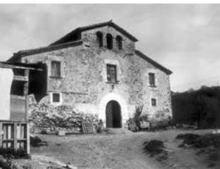
Masia de Ca n'Albareda.

Organitzador: Associació Kaleidoscopi-Sant Feliu