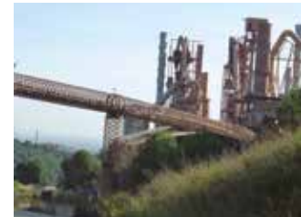
Cimentera Sànsion.

El conjunt industrial de la Sànsion planteja dubtes sobre el seu futur: aprofitament de les estructures o desaparició. En aquest acte es presentaran diferents alternatives amb la intenció d'oferir elements de judici sobre el tema. Organitzadors: USLA / Ateneu Santfeliuenc