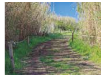
Parc Agrari del Baix Llobregat.

Donarem a conèixer les tasques que es fan dia a dia al parc amb l'objectiu de preservar i promoure els usos agrícoles, patrimonials i futurs dintre de l'entorn natural que envolta la vall baixa del Llobregat. Organitzador: Consorci del Parc Agrari del Baix Llobregat