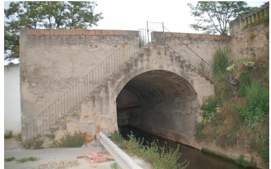
Figura 7. - Vista del pont de Can Capellans des de l'est. Una escala idèntica es reproduïx a l'altra banda l'estructura.

Tot i que aquest pont està clarament associat al Canal, no es pot considerar que formés part de la infraestructura des dels inicis. Els primers mapes del segle XIX mostren en aquest punt un camí que no arriba a travessar la sèquia i, molt prop, un pont. Sí que apareix recollit, en canvi, en el mapa de 1908.