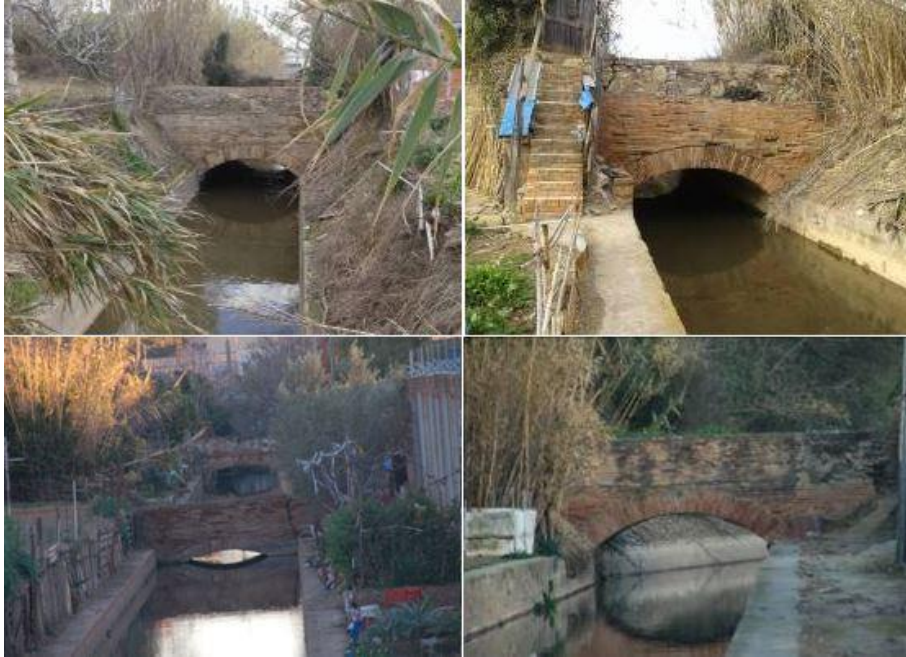
Figura 6.- Alguns dels ponts del Canal de la Infanta al seu pas per Sant Feliu de Llobregat

El cinquè dels ponts té una estructura peculiar (Figura 7). Està situat a l'antic terme de Santa Creu d'Olorda, davant de Can Capellans, avui dia territori de Molins de Rei. Ara aquest pont fa de línia divisòria entre un tram del Canal en superfície i un altre que es va soterrar a la dècada dels anys 90 com a conseqüència de la construcció d'una nau industrial. Malauradament està situat en el recinte privat d'una empresa i només es pot veure des del camí de Can Capellans.