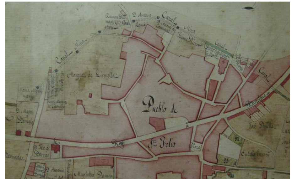
Figura 2. - Detall d'un plànol del Canal de la Infanta de 1838 corresponent al traçat a Sant Feliu de Llobregat.

Ara bé, com ja he dit, inicialment el Canal passava en superfície darrera de l'església i a l'altra banda de la carretera N-340. Aquest fet es comprova en el plànol de 1838 que ja he mencionat (Figura 2) i també a les actes dels plens municipals que entre 1905 i 1907 recullen les negociacions de l'Ajuntament amb la Junta del Canal per tal que aquesta última cobris o soterrés aquests trams.