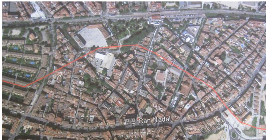
Figura 4. - Mapa google en el qual s'ha traçat amb una línia vermella el trajecte soterrat del Canal de la Infanta a Sant Feliu de Llobregat. Proporcionat per la Junta del Canal de la Infanta.

En tot cas, el pas soterrat o en mina del Canal té encara actualment una traça pràcticament idèntica a la que es va concebre en origen: des de l'actual passeig del Canal al costat de l'escola Gaudí, ressegueix el carrer Miquel Coll i Alentorn, remunta el que havia estat la Quadra de Palau per l'actual plaça de Catalunya, i travessa el passeig Nadal prop de la cantonada amb el carrer Vidal i Ribas, on encara es conserva sota el sòl un pou de registre. Després, segueix en direcció a l'església creuant Pi i Margall i es dirigeix a Sant Joan Despí travessant els carrers Torras i Bages, Joan Maragall i la carretera Laureà Miró a l'alçada del Casal de Joves. Des d'aquí passa als espais ocupats per les fàbriques del barri de Can Bertrand i, finalment, sense presència en superfície, surt del terme municipal per la zona que ara ocupen les instal·lacions de la Ciutat Esportiva Joan Gamper, tram que va ser cobert recentment amb motiu de l'operació urbanística promoguda pel Futbol Club Barcelona.