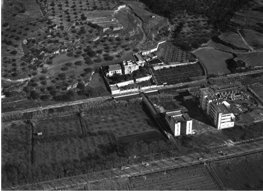
Figura 8. - Vista aèria de la zona de Can Capellans. Es veu el conjunt arquitectònic format per la capella, la masia i la torre residencial. En primer terme el pont de Can Capellans en tota la seva llargària, arribant pràcticament a la carretera. Es pot apreciar l'alineació entre el pont i l'accés principal a la casa. Foto de 1967.

un mur a cada banda de la via amb un pas a nivell davant de la casa. 10 Encara ara es pot veure com la calçada del pont queda perfectament arrencada amb les dues portes de ferro que permetien travessar la via i amb l'escalinata i porta d'accés principal a la casa.