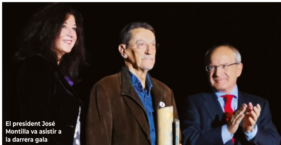
El president José Montilla va assistir a la darrera gala

Però 23 anys son molts i aquesta XI edició presenta canvis que permeten adaptar els premis a les noves circumstàncies que vivim i introduir petites millores basades en l'experiència de 10 edicions.