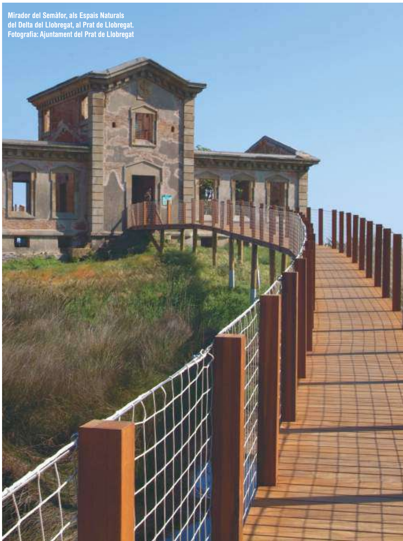
Mirador del Semàfor, als Espais Naturals del Delta del Llobregat, al Prat de Llobregat.