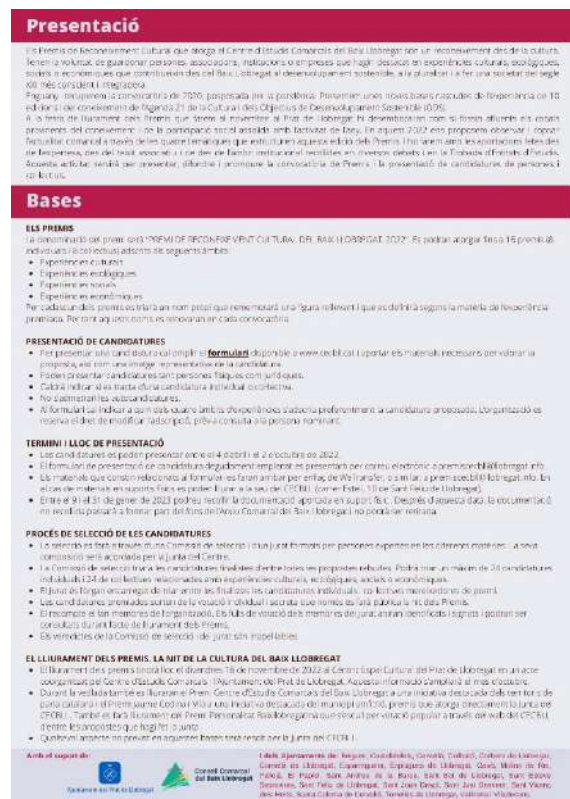
Anvers i revers de la versió digital de les bases dels XI Premis de Reconeixement Cultural del Baix Llobregat