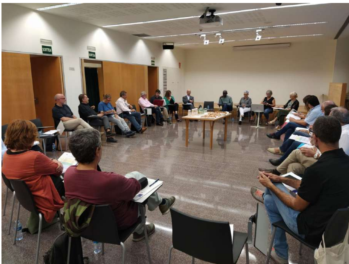
Reunió del Jurat dels Premis al Cèntric Espai Cultural del Prat de Llobregat. 26 d'octubre de 2022.

El Jurat es va reunir al Cèntric Espai Cultural del Prat de Llobregat el dimecres 26 d'octubre.