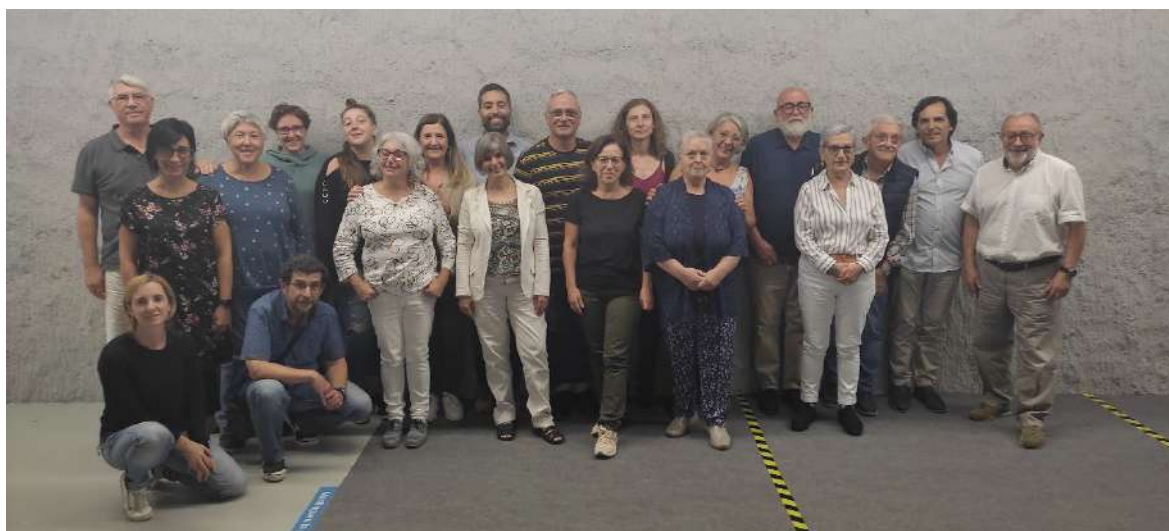
Fotografia de família de la Comissió de selecció en finalitzar la sessió de treball a la seu del CECBLL. 20 d'octubre de 2022.