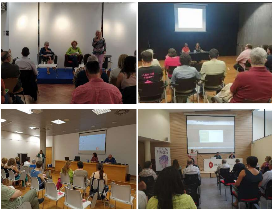
Quatre instantànies dels actes de dinamització dels Premis. De dalt a baix i d'esquerra a dreta: Experiències Socials a Sant Joan Despí, Experiències Econòmiques a Sant Andreu de la Barca; Experiències Culturals a Gavà; i Experiències Ecològiques a Collbató.

Es va construir un cartell general d'anunci dels quatre actes, amb poc detall informatiu, però que donava una visió global, i després un d'específic per a cada un dels actes, que desplegava tota la informació.