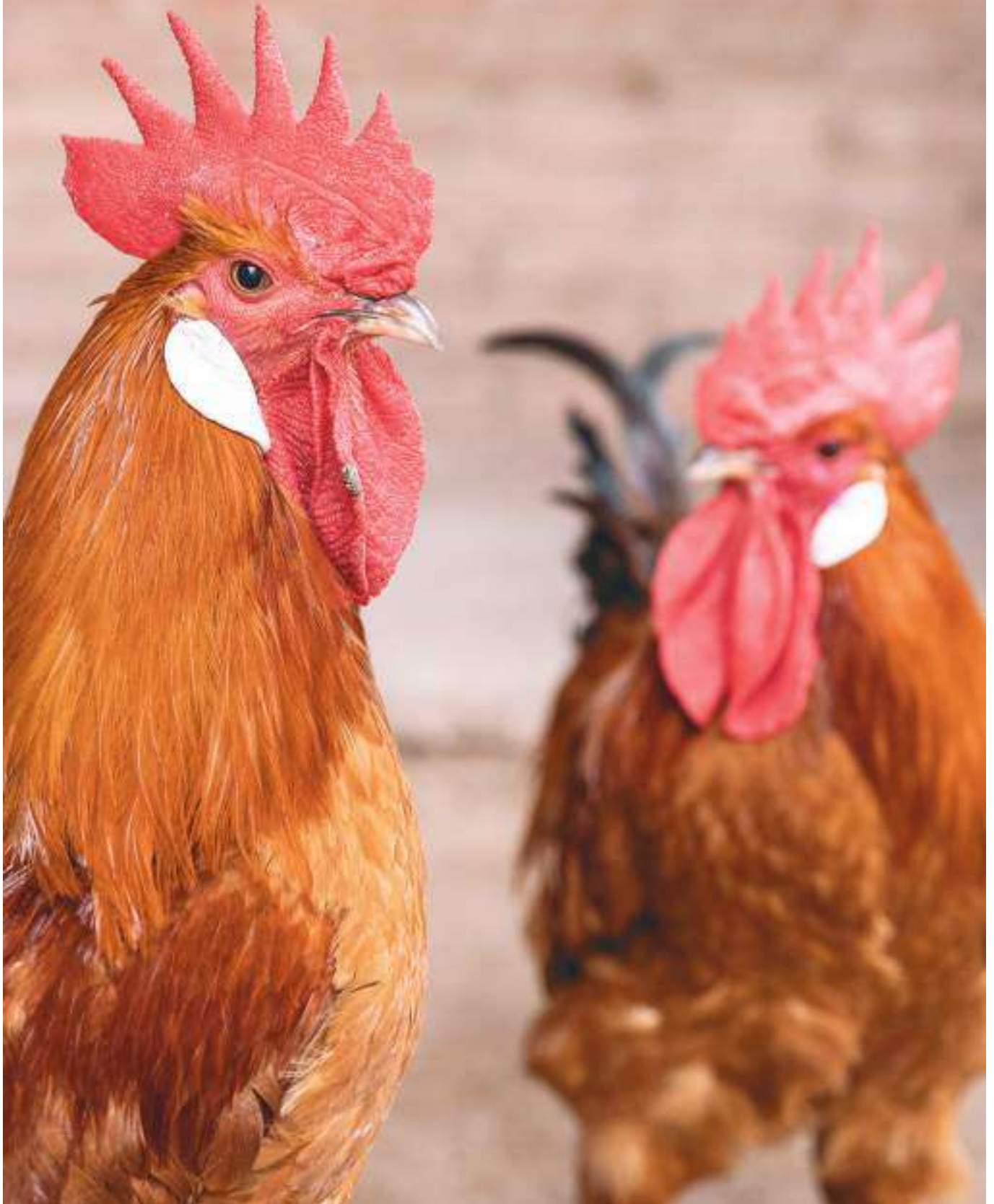
Exemplars de pollastres Pota Blava, del Prat de Llobregat.