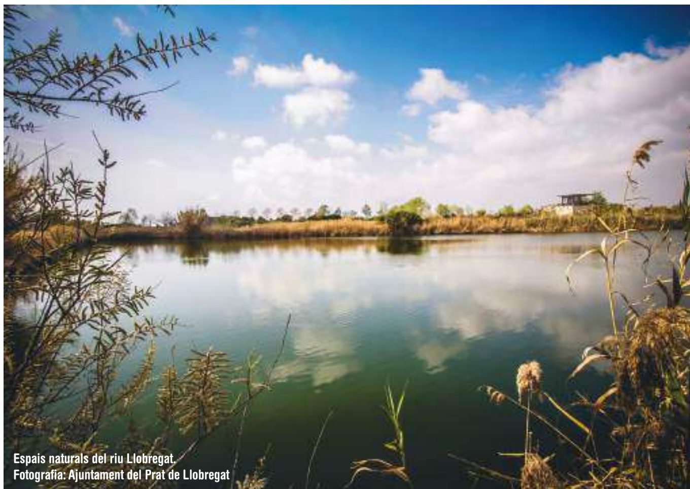
Espais naturals del riu Llobregat.

Lluís Tejedor va ser el primer alcalde en situar com a valor imprescindible per a la ciutadania un entorn natural de qualitat: "Un ciutadà no te res, té el paisatge i el territori, el salari social que tenim els ciutadans de la nostra comarca", va dir en certa ocasió. Va ser un dels impulsors de la creació del Consorci dels Espais Naturals del Delta i del Consorci del Parc Agrari, ambdós formats per diversos ajuntaments i per la Generalitat entre altres.