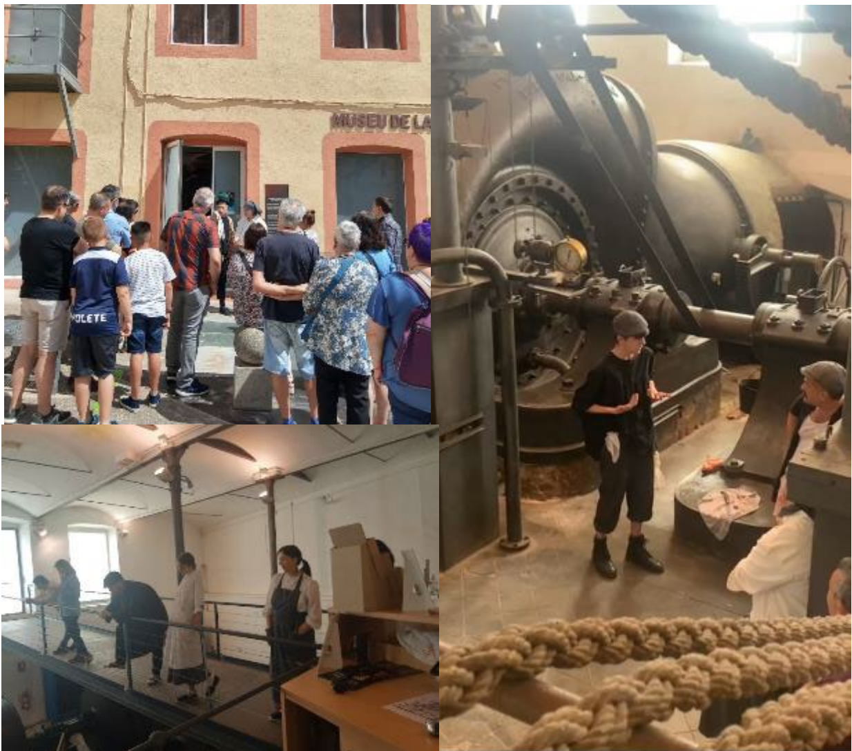
Diversos moments de les visites teatralitzades amb motiu del Dia Internacional dels Museus. S'aprecia la cua que fa el públic a la porta, esperant el seu torn d'entrada.