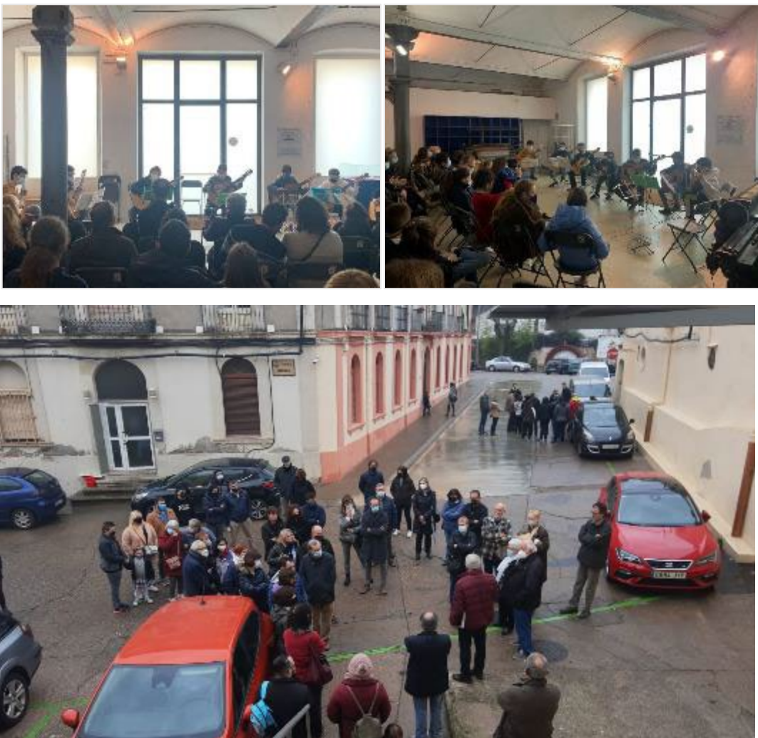
A dalt dues instantànies del concert de l'EMM i a baix un grup de visitants el 13 de febrer, dia de portes obertes.