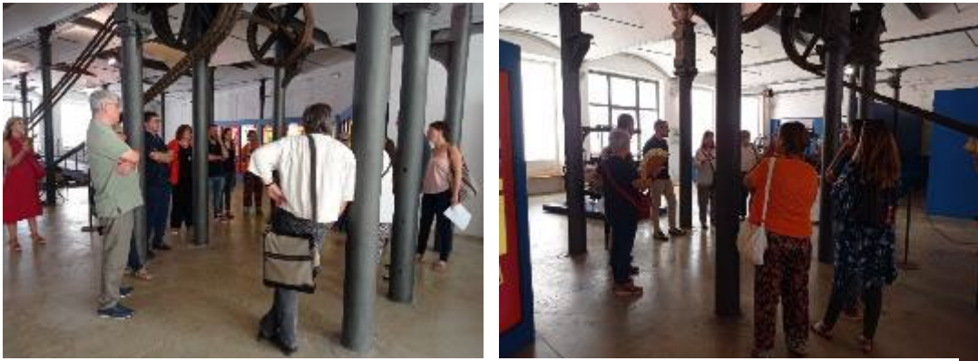
Dos moments de la visita d’alcaldes/ses, regidors/res de Cultura i consellers/res comarcals.