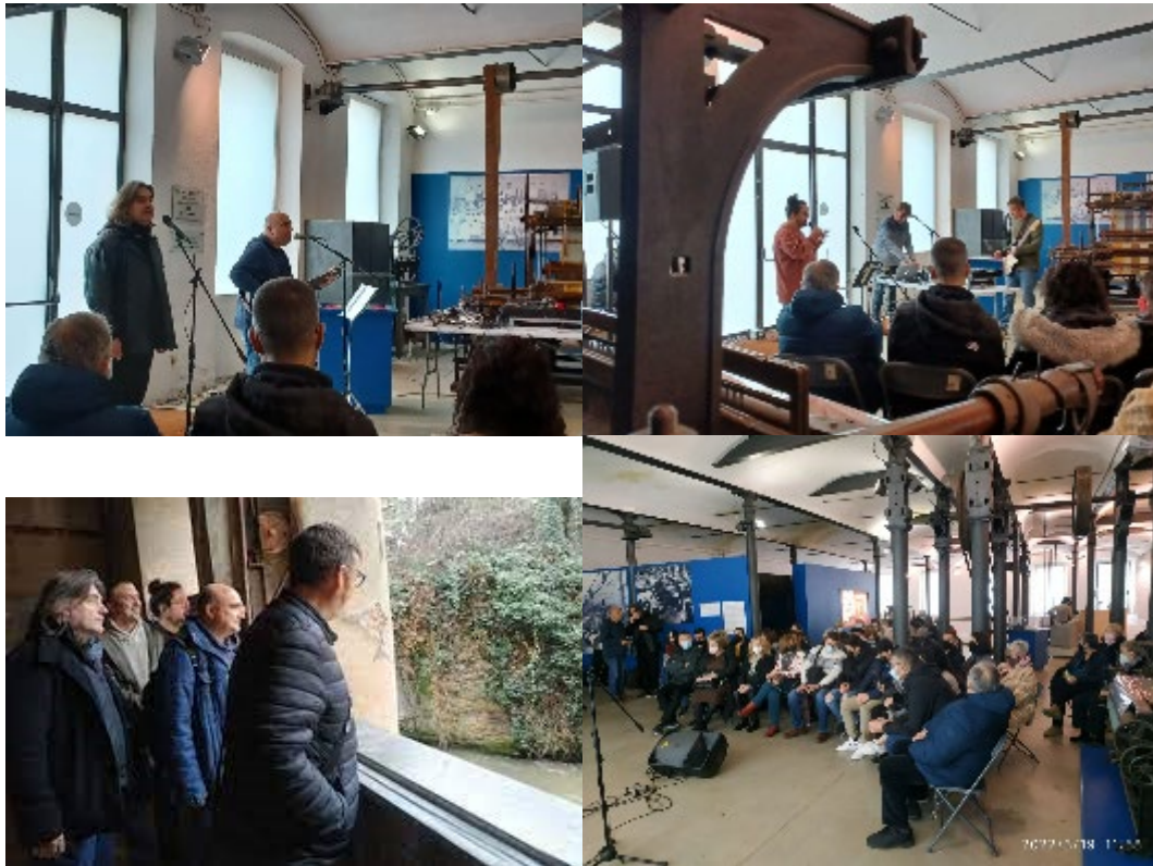
Diversos moments de l'espectacle "Fàbrica de poetes".